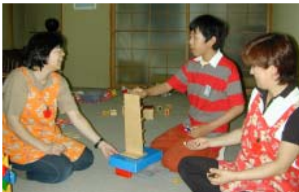
託児も行っていますので、安心です